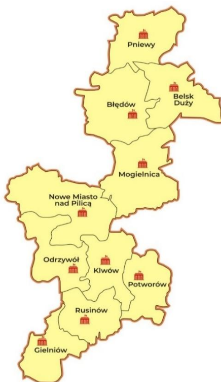
Rysunek nr 1 Obszar objęty LSR .

Obszar LSR obejmuje 1074 km 2 , zamieszkały przez 53 388 ludzi. Wszystkie gminy z racji spójności terytorialnej i usytuowania w pobliżu tras mają bardzo dobry układ komunikacyjny. Warunki przyrodnicze oraz ukształtowanie terenu czynią obszar LGD spójnym pod względem geograficznym i administracyjnym.